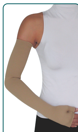
ΓΑΝΤΙ-MΑΝΙΚΙ ΛΕΜΦΟΙΔΗΜΑΤΟΣ ΜΕ ΠΑΛΑΜΗ

Ref.no. 12745 Medium 12746 Long Μεγέθν: S - XXL