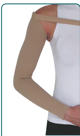
ΓΑΝΤΙ-MΑΝΙΚΙ ΛΕΜΦΟΙΔΗΜΑΤΟΣ ΜΕ ΖΩΝΗ