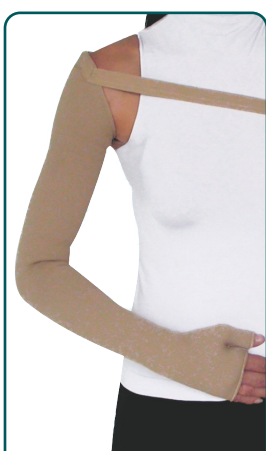
ΓΑΝΤΙ-MΑΝΙΚΙ ΛΕΜΦΟΙΔΗΜΑΤΟΣ ΜΕ ΖΩΝΗ & ΠΑΛΑΜΗ

Ref.no. 12735 Medium 12736 Long Μεγέθν: S - XXL